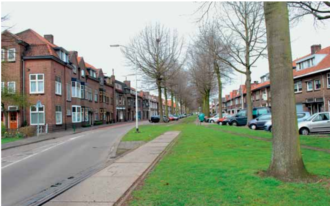
Een van de vier overgebleven Maliebanen, ooit aangelegd door Prins Maurits van Oranje tijdens het Twaalfjarig Bestand. Hij doorsnijdt Belcrum.