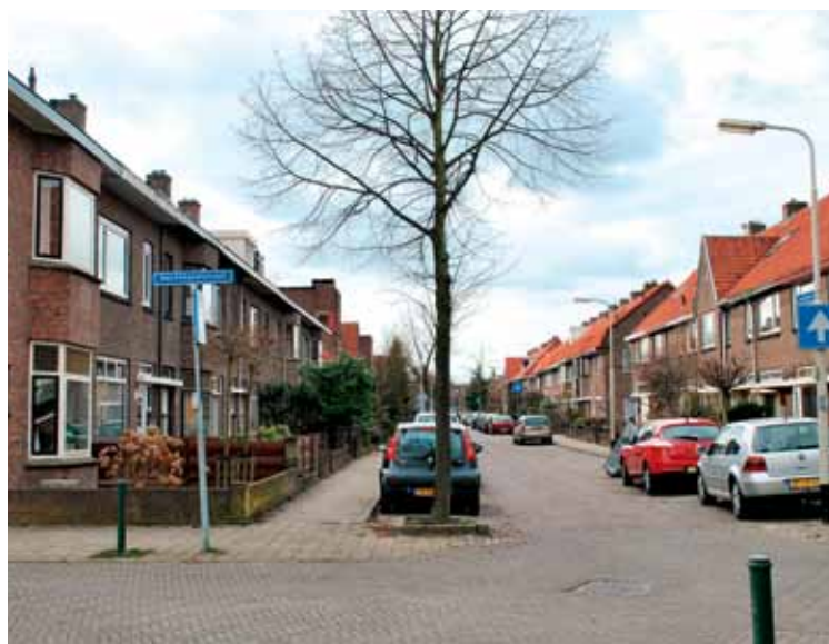
De vogelnamen van de straten in Belcrum zijn een ode aan het moerasbos dat er in de 17 e eeuw lag.