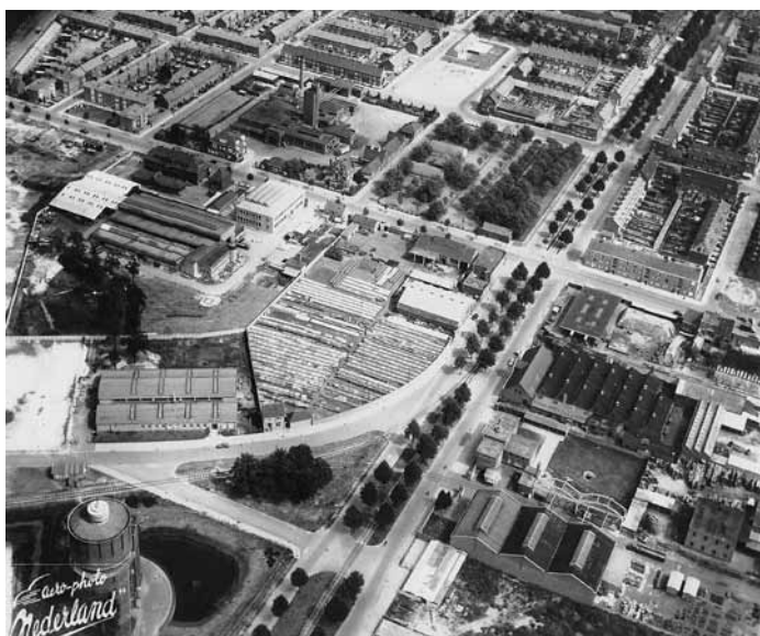
De ontwikkeling van Belcrum. Vooraan de industrie en achteraan de woningen.